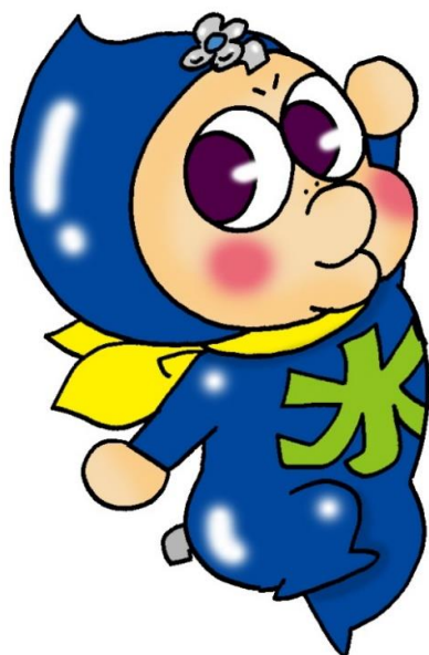
水道やはばキャラクター 「じゃじゃっとくん」

「水道やはば」ホームページ( https://suidou.town.yahaba.iwate.jp )では、 ★じゃじゃっとくんの節水大作戦★を掲載しています。