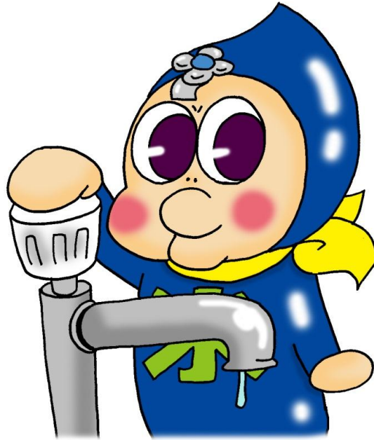
水道やはばキャラクター 「じゃじゃっとくん」

「水道やはば」ホームページ（ http://suidou.town.yahaba.iwate.jp ）では、★じゃじゃっとくんの節水大作戦★を掲載しています。